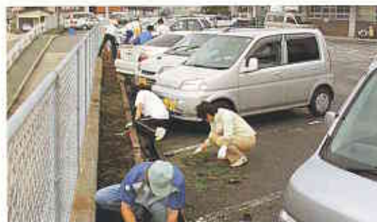
正面駐車場の花壇にコスモスの苗を植えました。秋が楽しみで～す!!

“この掲示板、もともとはこんなに白かったんだー” 外来の凡事徹底に参加したときにそう思いました。 翌日に清掃したところを眺めると、心なしか嬉しく 感じたものです。この病院とも来年にはお別れで、 新病院に引っ越すこととなります。今後は、凡事徹 底の日だからきれいにするのではなく、汚れた所を 見つけたら自主的に掃除するように心がけて、新病 院の美しさをいつまでも保っていきましょう!!