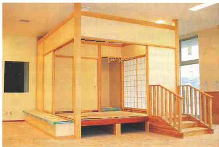
理学療法室内の生活動作練習施設