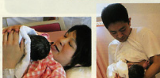
ママ分娩台で抱っこ