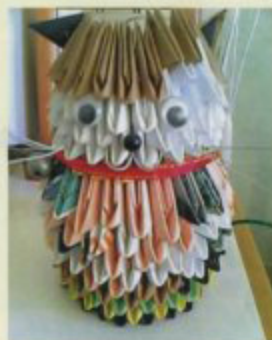
患者さんの作品です

9月12日には老人看護月週の行事として“お月見会”を行いました。お饅頭を食べていただいたり、嚙下体操も行いました。わずかの時間でしたが、患者さんはもちろん、御家族の方、友人の方にも来ていただくことができ楽しい一時を過ごすことができました。