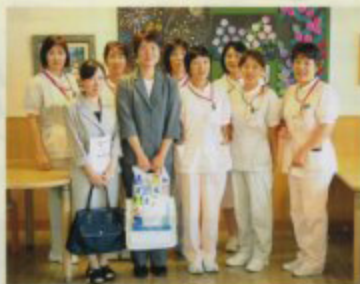
三重県の病院より病院視察に来院されました

ご家族の方にも気軽に声をかけていただき、地域の皆様から期待される病棟でありたいと思っています。