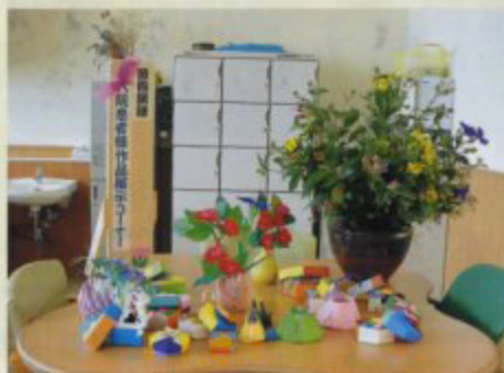
お月見会で飾りました