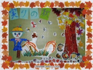
島根県済生会江津総合病院の患者さんへのプレゼント